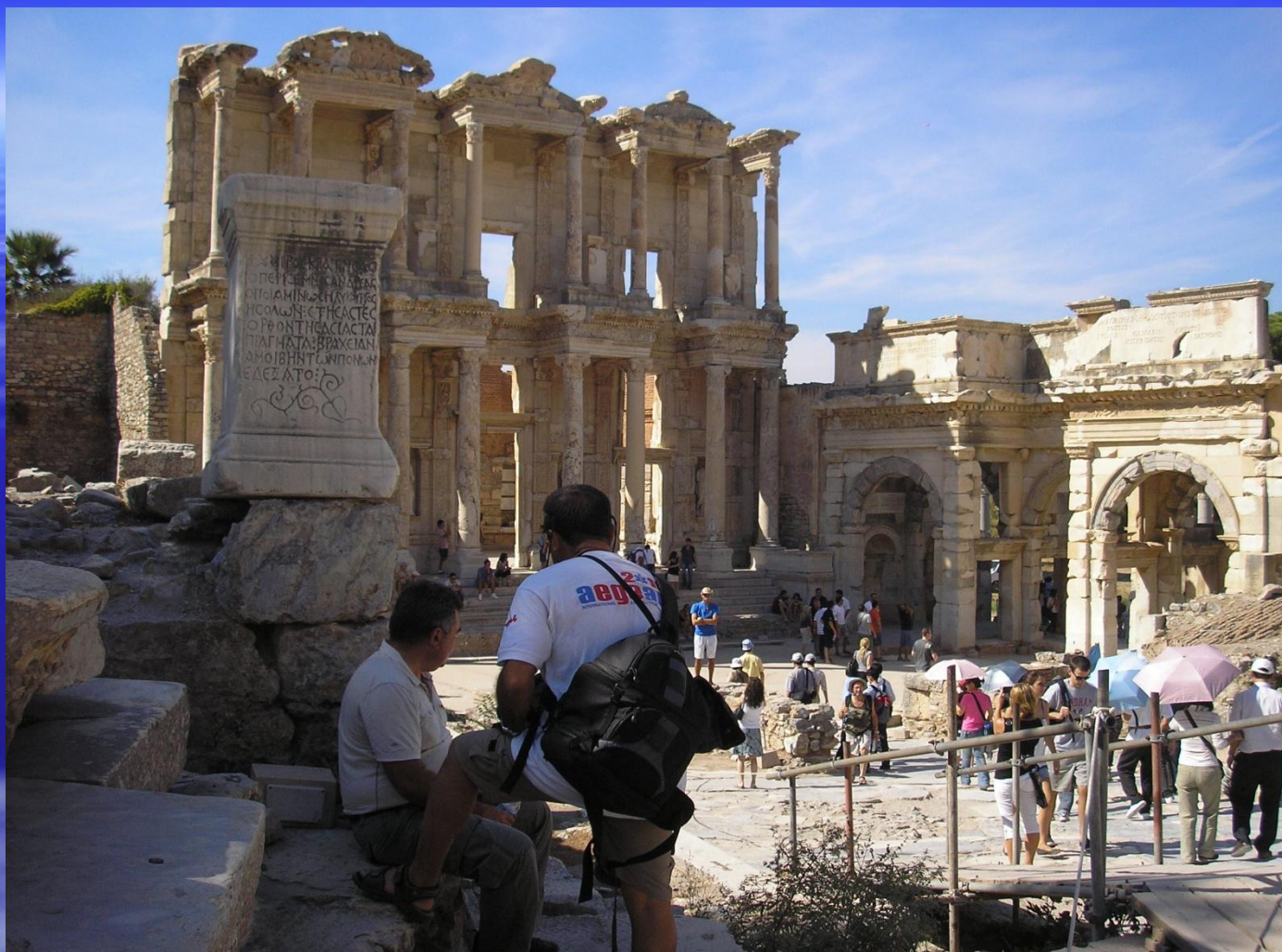
Vykopávky v Efezu